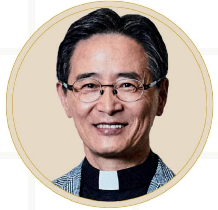
심종혁 총장 서강대학교

지금 우리는 인공지능과 디지털 전환, 글로벌 자산시장의 변화 속에서 단순한 정보보다 '통찰과 해석의 힘'이 더욱 중요한 시대를 살아가고 있습니다. 빠르게 변화하는 환경 속에서 미래를 준비하기 위해서는 균형 잡힌 시각과 실질적인 판단 역량이 무엇보다 중요해지고 있습니다.