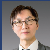
전선를 부총장 서강대학교