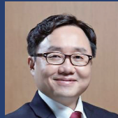
박수용 교수 서강대학교 컴퓨터공학과 웹3.0포럼 의장