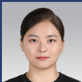
이보라 겸임교수 서강대학교 미래교육원 Microsoft MVP