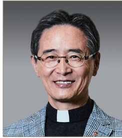
심 종 혁 서강대학교 총장

우리 사회는 지금 블록체인, 디지털자산, 웹 3.0, 생성형 인공지능 같은 혁신 기술이 기존 금융과 산업의 질서를 빠르게 바꿔 놓고 있는 거대한 변화의 한가운데 서 있습니다. 이 변화의 중심에는 특히 스테이블코인이 있습니다. 스테이블코인은 달러 등 실물 자산의 가치에 연동돼 가격 변동을 최소화한 암호화폐로, 디지털 시대로의 전환 속에서 글로벌 자본이 움직이는 새로운 인프라로 떠오르고 있습니다.