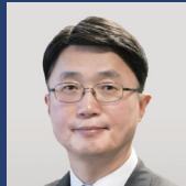
류제명 제2차관 과학기술정보통신부